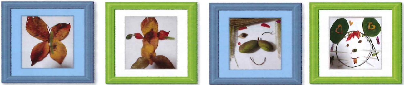
作品: カフェだより担当者

芸術の秋、落ち葉アートにチャレンジしてみてもはどうですか?これであなたもアーティスト♪ 【準備するもの】落ち葉・枝・木の実等 画用紙 木工用ボンド