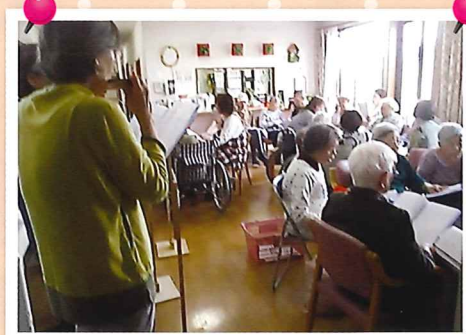
※コロナ前のカフェの様子

お茶を飲んだ後に、「あざみ会」の方々の伴奏に合わせて、愛の家グループホームの入居者様と一緒に歌を歌ったり、とても楽しい時間を過ごしております。