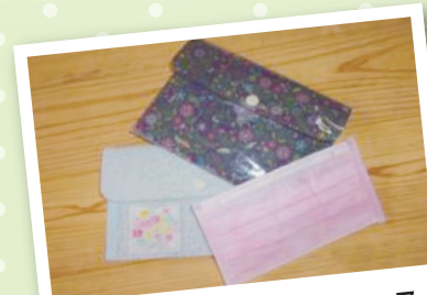
好きな包装紙でマスクケース