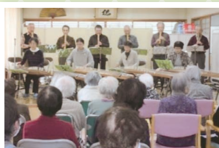
【尺八&大正琴演奏会】