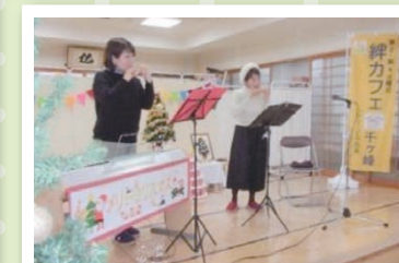
【ピアノ・オカリナ演奏会】