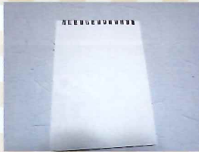
①台紙に下絵を描く